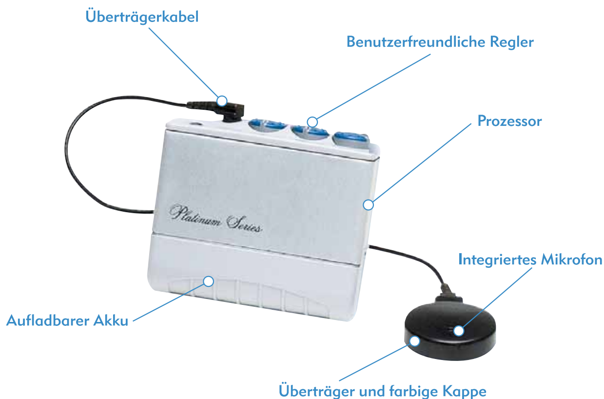
■ Soundprozessor der Platinum-Reihe

Der Soundprozessor der Platinum-Reihe (PSP) ist ein kleiner, am Körper getragener Soundprozessor, der häufig von Eltern kleiner Kinder bevorzugt wird, die noch zu klein für einen am Ohr getragenen Prozessor sind. Auch manche Erwachsene entscheiden sich für diesen Prozessor, da sie es genießen, lediglich den Überträger am Kopf zu tragen und nichts am Ohr. Es ist so einfach. Der PSP ist auch für Menschen mit Sehbehinderungen oder Problemen mit der Beweglichkeit der Hände eine gute Alternative. Der PSP verfügt über die gleichen Soundverarbeitungsprogramme wie die am Ohr getragenen Prozessoren - für unverfälschte Klangqualität.